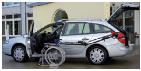
Robot 3000. Direkte Platzierung des Rollstuhls neben der Fahrertür. Wir haben ein Video vom Robot 3000 in Aktion auf unserer Website.